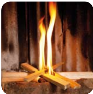
Durch ausreichend Luftzufuhr rasch helle, hohe Flammen herstellen.