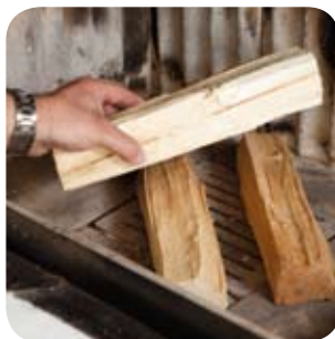
Das Holz locker in den Brennraum schichten.