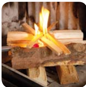
Von oben anzünden.