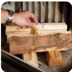
Anzündhilfe auf den Brennholzstapel legen.