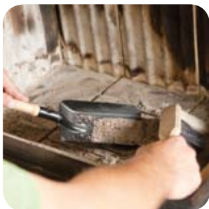
Den Ofenraum von Asche säubern.