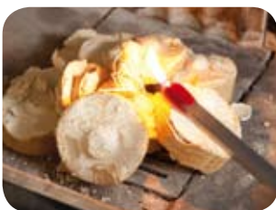
Verwendung von Holzbriketts: Briketts in Stücke zerteilen, genügend Raum zur Ausdehnung lassen und obenauf die Holzwolle platzieren.